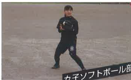
女子ソフトボール部