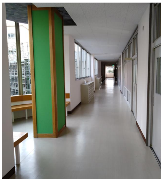
↑ 廊下 (ホールウェイです!)