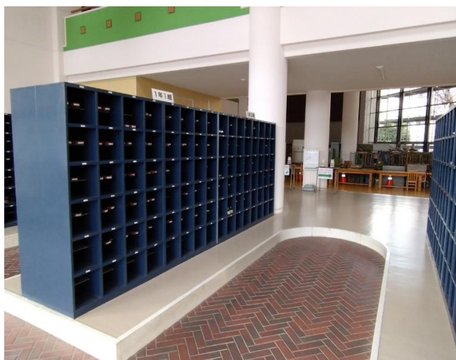
↑ 玄関 (エントランスです!)