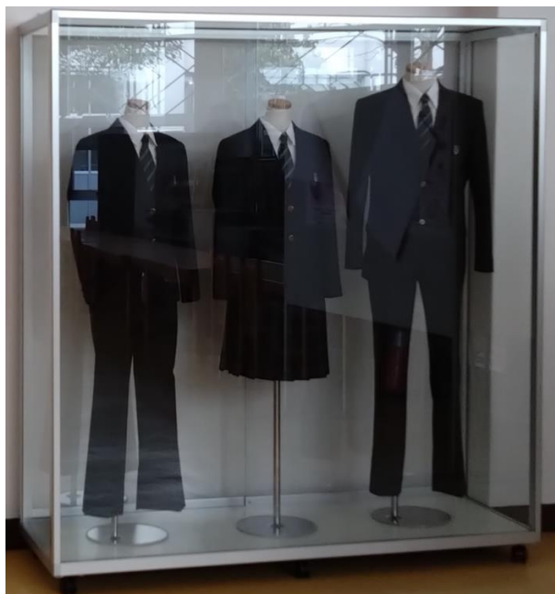
↑ 新制服の常設展示コーナー (1階 コモンホール)