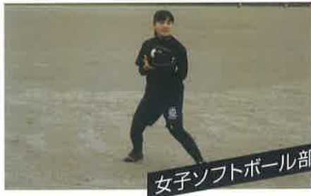
女子ソフトボール部