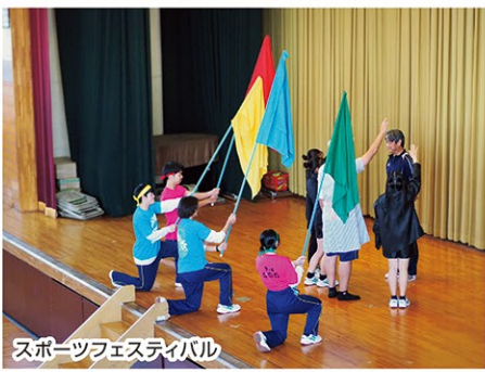
スポーツフェスティバル