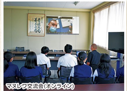
マヌレワ交流会(オンライン)