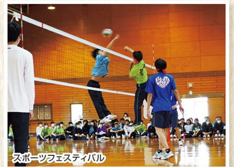
スポーツフェスティバル