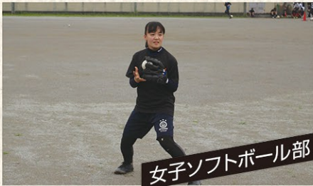
女子ソフトボール部