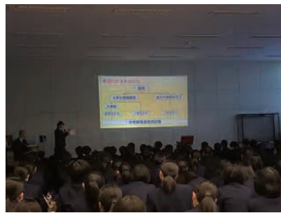
ライフプラン（総合学習）発表会