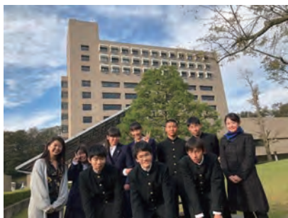
1年 大学見学（首都圏）