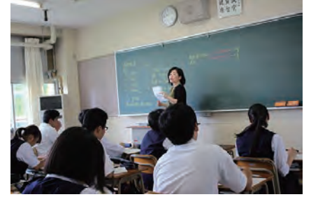
英語での少人数授業

少人数指導の授業では生徒と先生との距離が近く、疑問に思ったことなどはすぐに質問できます。また、自分の習熟度に合わせた授業を受けることができ、自分のペースで学習できるのも魅力です。