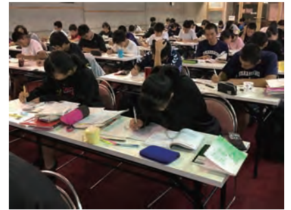
学習合宿は3泊4日。33時間しっかり勉強します。