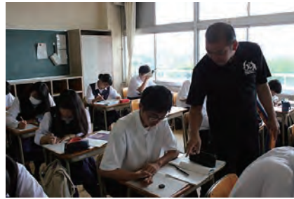
課外でも先生がきめ細かくサポート。

私は早朝課外や英語科の先生との学習を重ねて、英検2級に合格することができました。高崎東は課外や授業が習熟度別となっており、自分の力にあった学習環境で、しっかり自分の力を高めることができます。