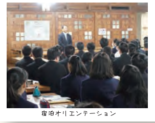
宿泊オリエンテーション