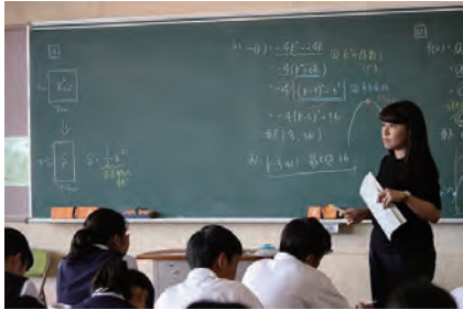
数学での少人数授業