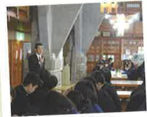
宿泊学習 オリエンテーション