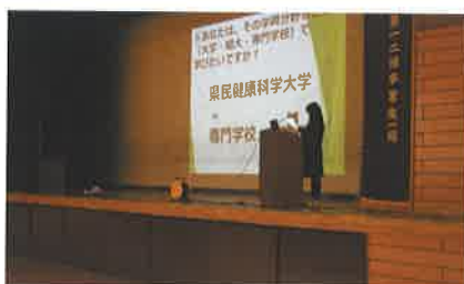
ライフプラン(総合学習)発表会