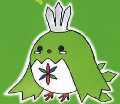
キャラクターデザイン/平成25年度卒業生

三、競う日もあれ またともに 笑う日もあれ 学び舎に 櫛の枝樹 めぐりつつ 心は遠く 天がける 春秋三年 とこことわに ああわが母校 高崎東高校