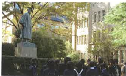
1年 大学見学(首都圏)